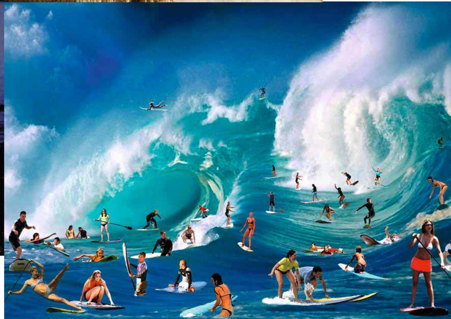
Ci-dessus, The Way you make me , série « Wild Style », 2014. Page de droite, en haut, L'Instant décisif , 2012. En bas, série « Paparazzi », 2014.