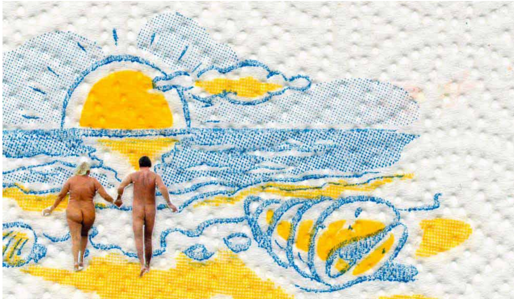
Ci-dessus, série « Nunuche », 2014. Ci-contre, Copycat , série « Wild Style », 2014. Page de droite, Le Déclencheur , série « Profession : artiste », 2012.