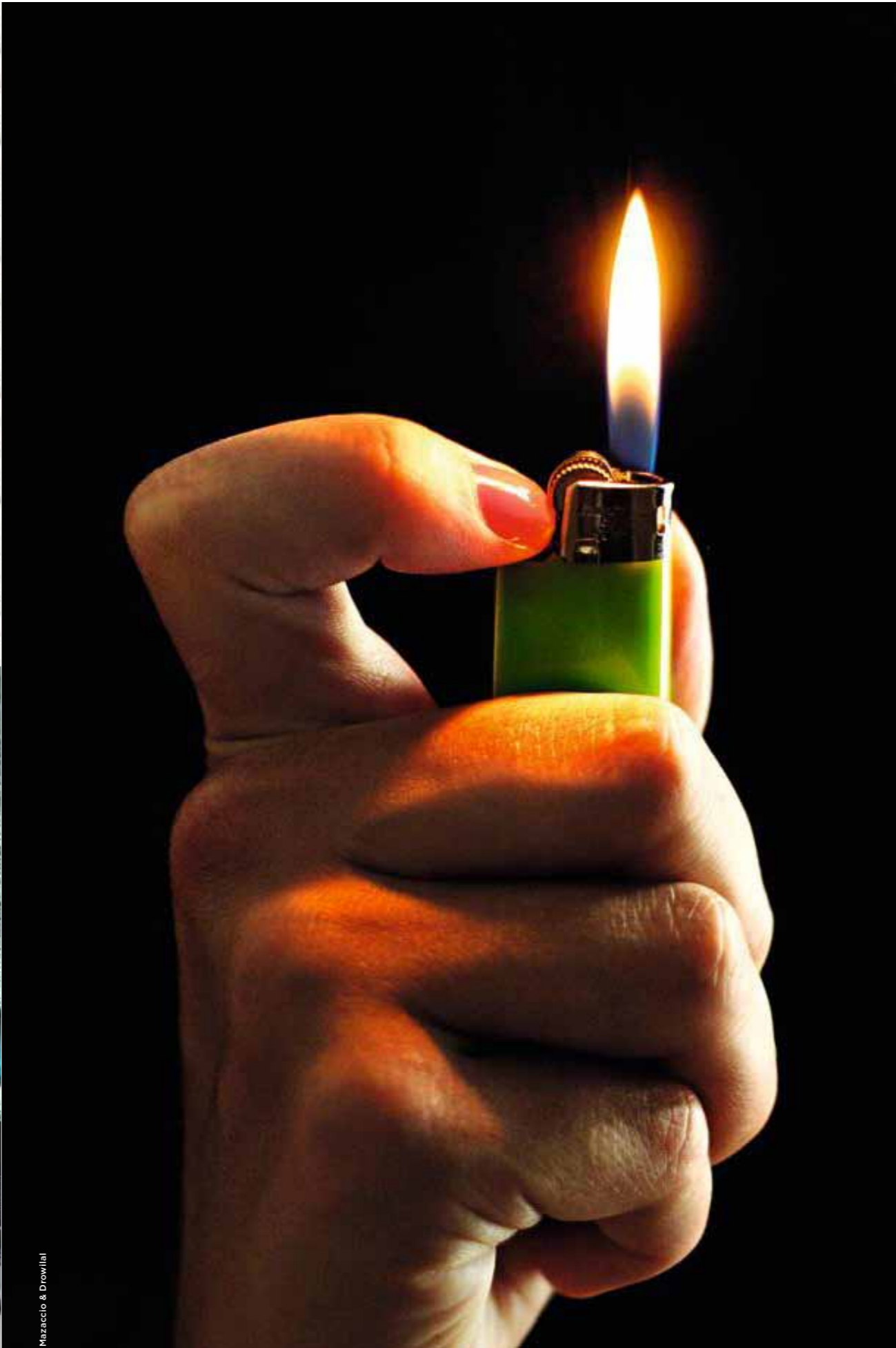
Mazaccio & Drowilal