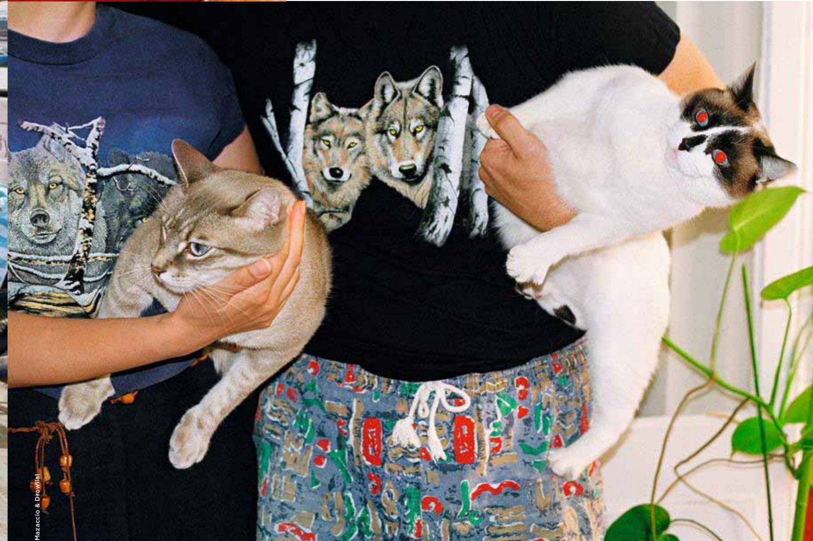
Page de gauche, Double dragon , série « Wild Style », 2014. Ci-contre, Le Déclencheur , série « Profession : artiste », 2012. Ci-dessous, Double impact , série « Wild Style », 2014.