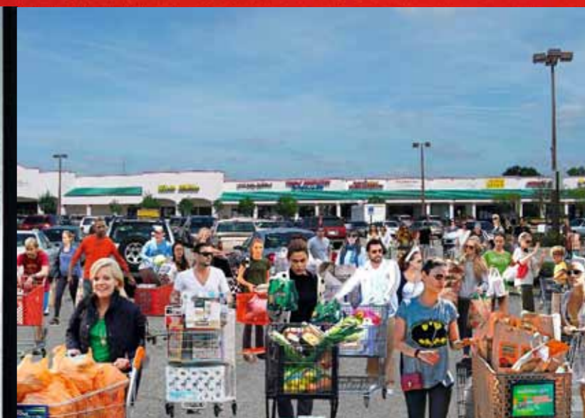
En haut, As Good as it Gets , série « Wild Style », 2014. Ci-contre, Le Déclencheur , série « Profession : artiste », 2012. Ci-dessus, série « Papparazzi », 2014.