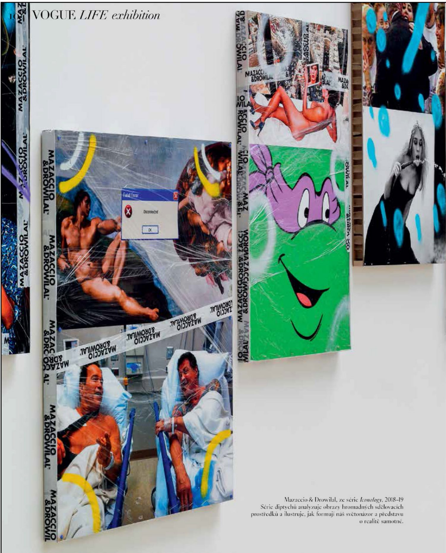
Mazaccio & Drowilal, ze série Iconology , 2018-19 Série diptychů analyzuje obrazy hromadných sdělovacích prostředků a ilustruje, jak formují náš světový názor a představu o realitě samotné.